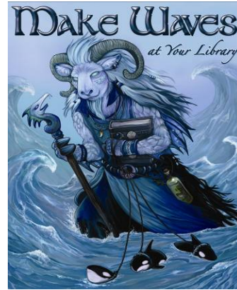
گرما 2010 نوبالغان کے لیے مطالعے کا پروگرام